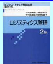
「ロジスティクス管理2級」標準テキスト