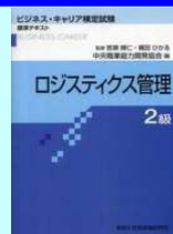
「ロジスティクス管理2級」標準テキスト