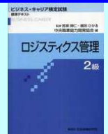
「ロジスティクス管理2級」標準テキスト