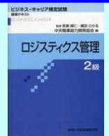
「ロジスティクス管理2級」標準テキスト