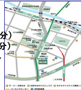
連合会館までの地図