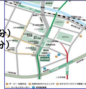
連合会館までの地図