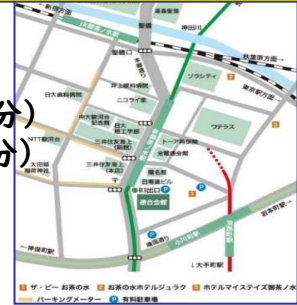
連合会館までの地図