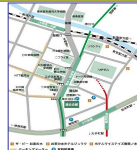
連合会館までの地図