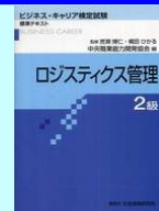
「ロジスティクス管理 2級」標準テキスト