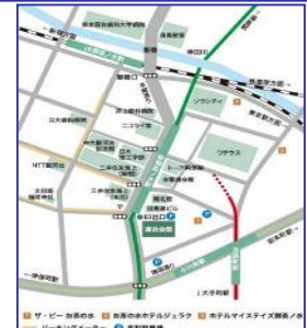
連合会館までの地図