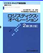
「ロジスティクス・オペレーション2級」標準テキスト