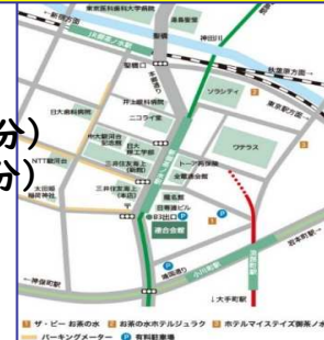
連合会館までの地図