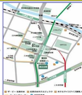
連合会館までの地図