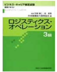
『ロジスティクスオペレーション3級』標準テキスト使用。