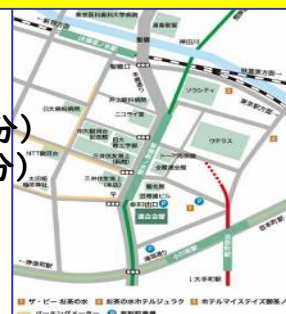
連合会館までの地図