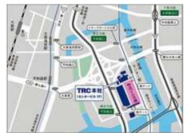
流通センター駅改札前