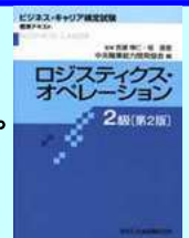
「ロジスティクス・オペレーション2級」標準テキスト