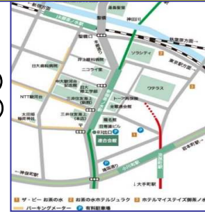
連合会館までの地図