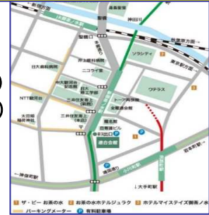
連合会館までの地図