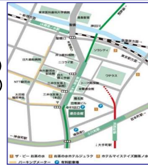
連合会館までの地図