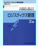
「ロジスティクス管理2級」標準テキスト