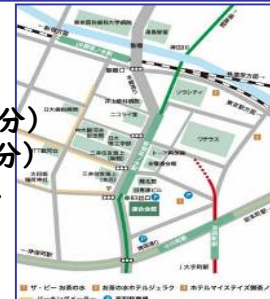
連合会館までの地図