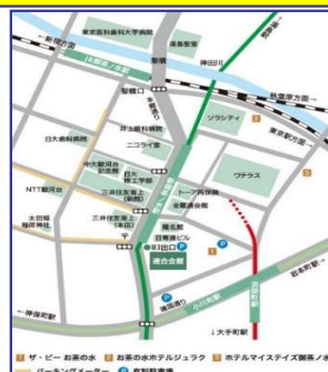
連合会館までの地図