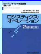
「ロジスティクス・オペレーション2級」標準テキスト