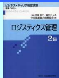
「ロジスティクス管理2級」標準テキスト